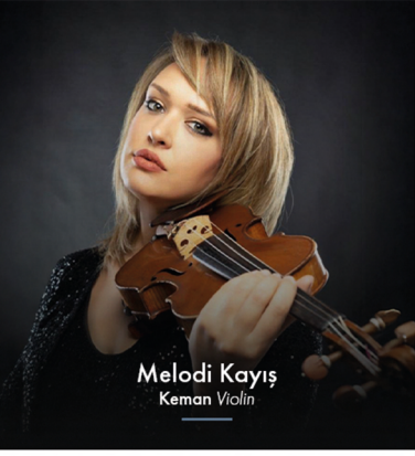
Melodi Kayış Keman Violin