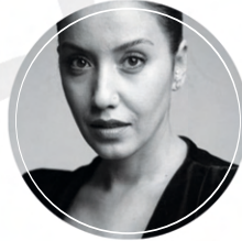
GÖRKEM EZGİ YILDIRIM Soprano